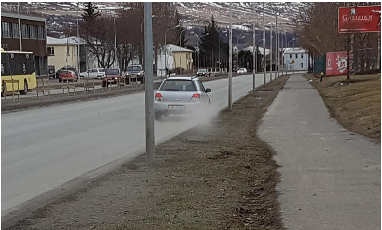
Glerárgata, 11.4.2018. Mikið ryk þyrlast upp þó að búið sé að sópa fyrstu umferð. Enn meira á eftir strætó og stórum bílum en hér sést.