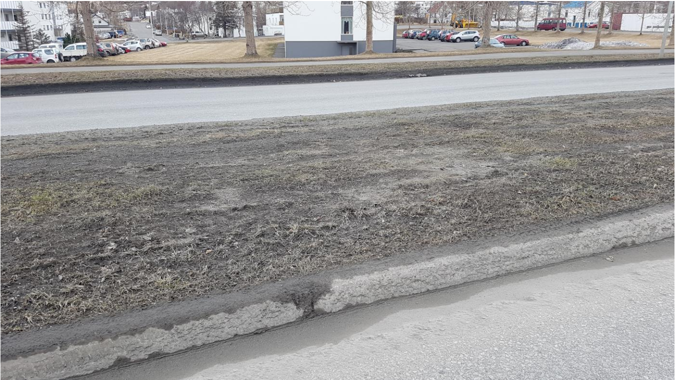
Miðeyja Hörgárbrautar, 11.4.2018. Eyjan er drullug en hreinsun götu skilar áberandi meiri árangri