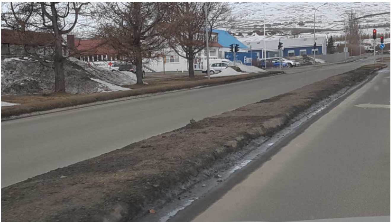
Þingvallastræti, 28.3.2018. Varla sést í grasið á miðeyjuni. Hér er grófhreinsun götu lokið.