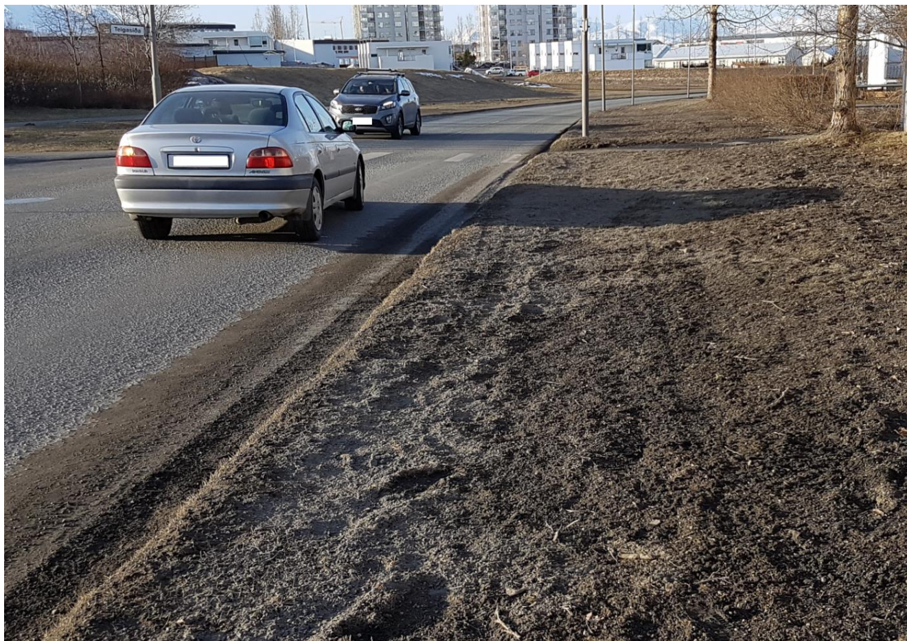
Hlíðarbraut við Teigasíðu, 10.4.2018. Hér er ekki búið að sópa fyrstu umferð.