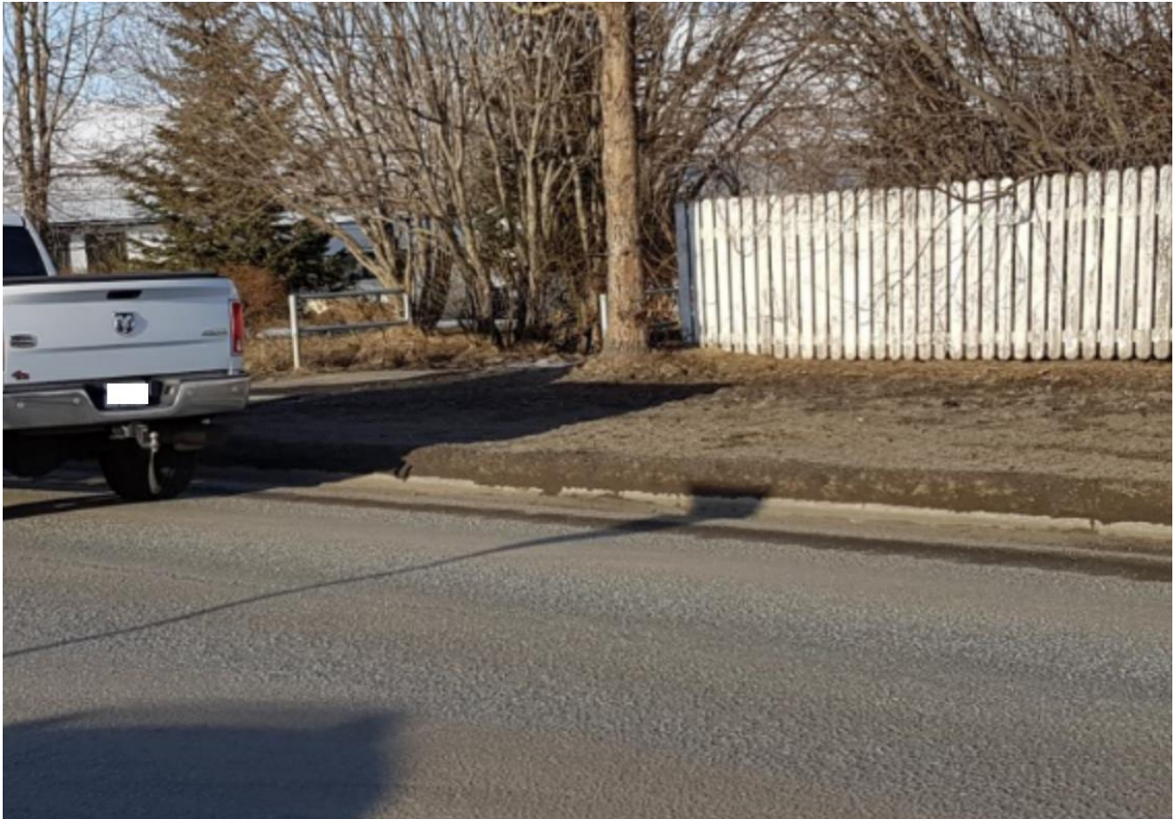
Hlíðarbraut við Teigasíðu, 10.4.2018. Drullan nær a.m.k. 20 cm upp fyrir kantsteininn.