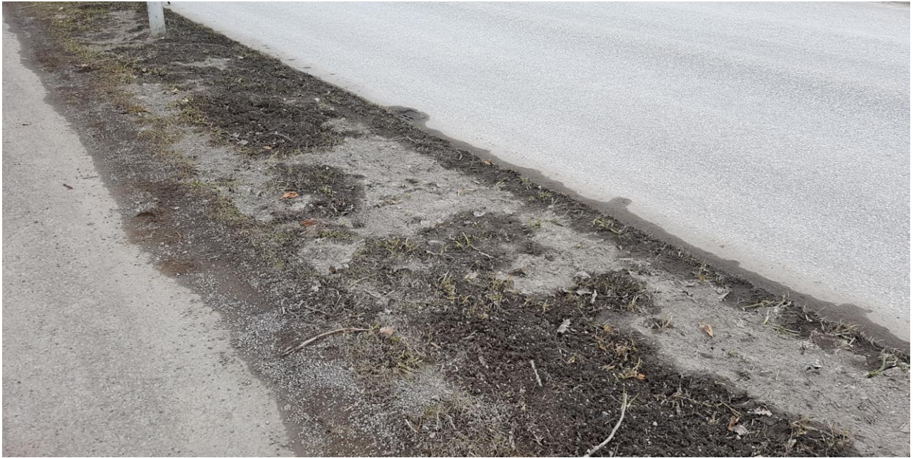
Glerárgata, 11.4.2018. Grasrönd milli götu og göngustígs.