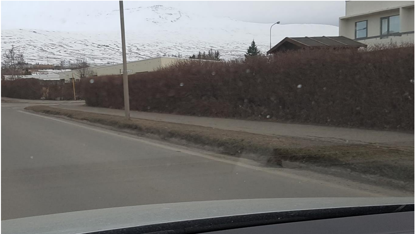
Þingvallastræti, 28.3.2018. Drullan hefur hlaðist upp árum saman og nær hátt upp fyrir kantsteininn.